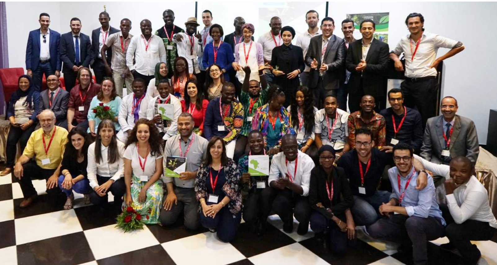
Participants au Forum qui s'est tenu en juin 2018, à Marrakech.